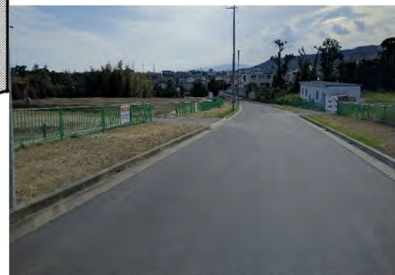
■現地写真(2019年6月撮影)