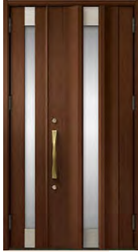
ポートマホガニー