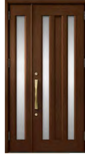
ポートマホガニー