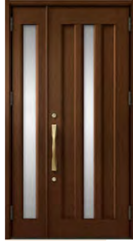
ポートマホガニー