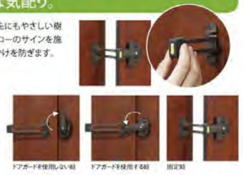
ドアガードを使用しない時

※ドアガードは未読者専用です。在宅時には防犯のための必ず設置してください。 ※写真は標準ドア用です。