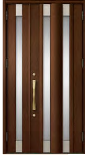
ポートマホガニー