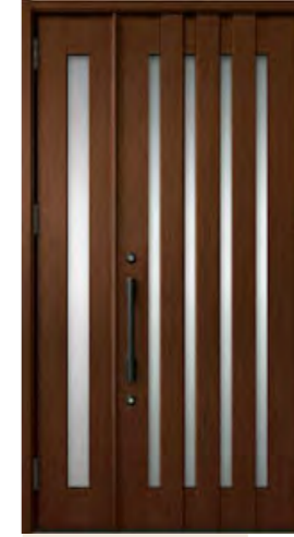
ポートマホガニー