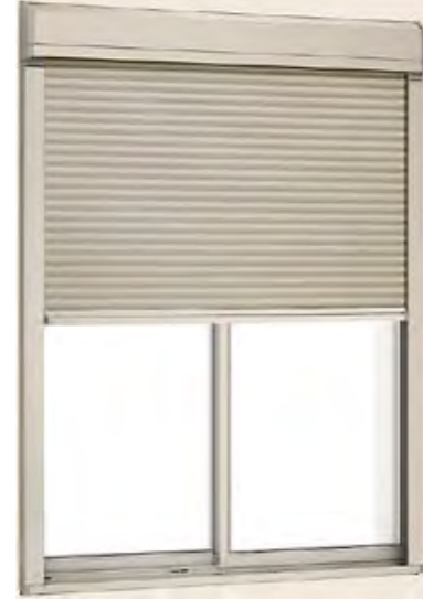
シャッター付引違い窓