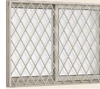
面格子付引違い窓 ヒシクロス