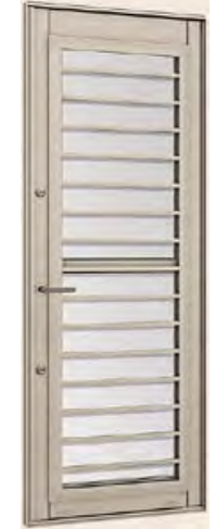
採風勝手口ドアFS (シリンダー付)